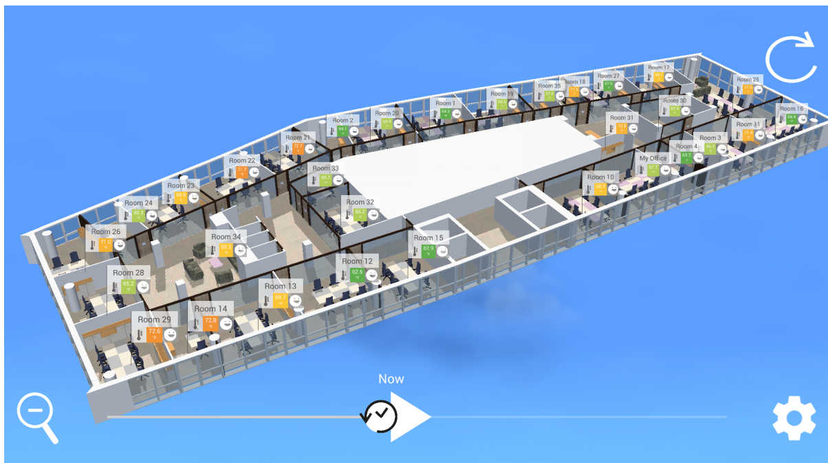
Jumeau numérique Ubiant

La plupart des grandes entreprises et des pays s'engagent sur cette échéance de 2050. Les outils numériques vont être prépondérants dans la gouvernance de cet enjeu, du fait de la complexité et du nombre de paramètres à gérer. À l'instar d'autres secteurs industriels, les jumeaux numériques, qui sont utilisés dans l'aviation ou l'automobile pour optimiser les processus de fabrication et de gestion des actifs physiques, vont massivement être déployés dans l'industrie du BTP, pour devenir à terme, la colonne vertébrale des bâtiments « zéro carbone ».